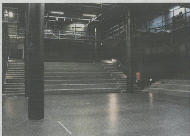
Teatersalen er stadig moderne og får lov at genopstå, som den er.

Multikunstneren Hans Krull kommer fra midten af februar til at stå i spidsen for en workshop, hvor beboere i Gellerup og resten af Aarhus kan være med til at give foyeren en kunstnerisk overhaling, så den bliver indbydende, både som indgang, men også som et