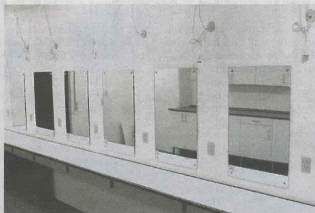
Lokalerne bag ved scenen er forsømt. Men så længe fremtiden for teatret er usikker, bliver de brugt, som de er.

»At der findes et lukket teater er i mine øjne en dødsynd. Teatret er meget vigtigt som samlingssted. Vi har behov for et sted at fortælle historier, be-