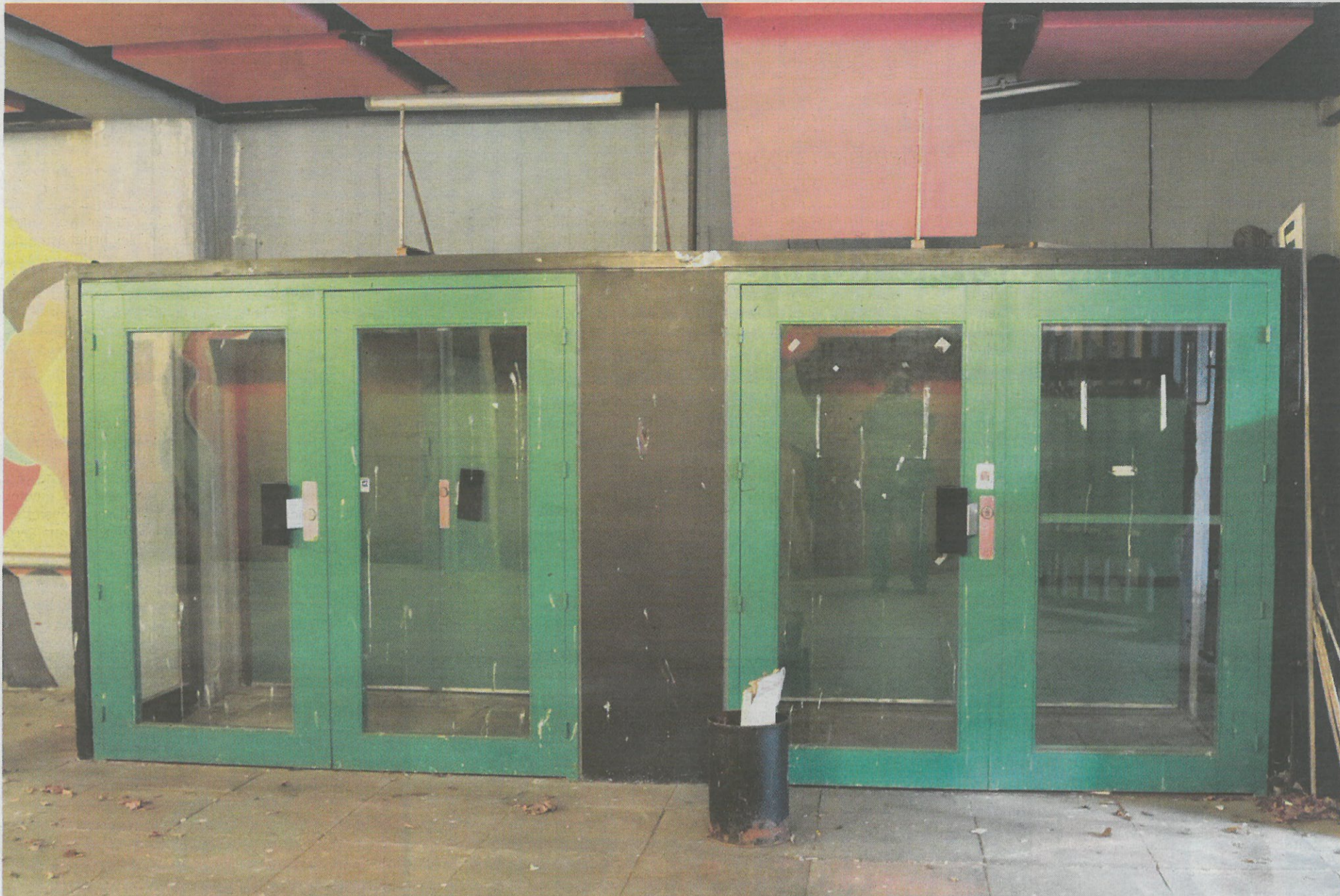
Indgangen til det gamle Gellerupscenen er medtaget. Men det lukkede teater får snart nyt liv under Eutopia, der er en del af Aarhus 2017.