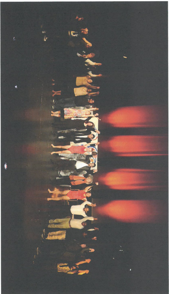
Et begejstret publikum klappede af EUTOPIA Stages åbningsforestilling Collage lavet af kunstnere fra nær og fjern