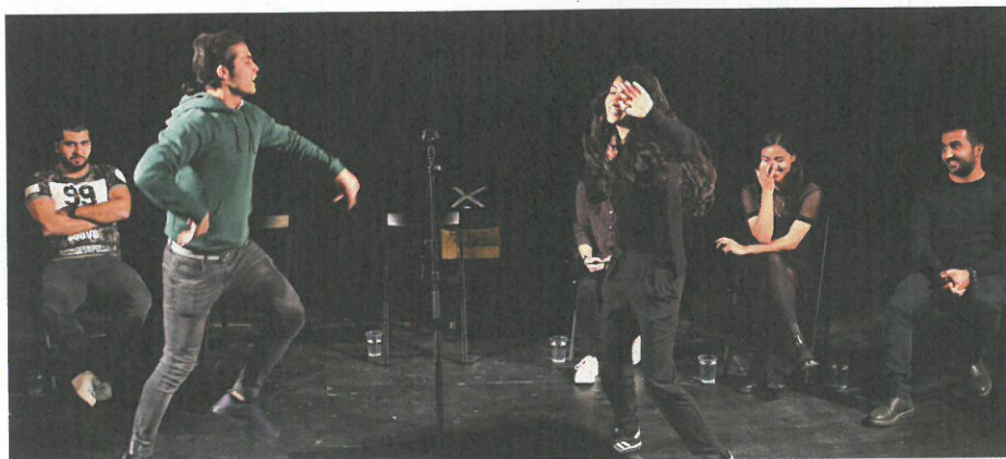
Der blev gjort grin med den danske datingkultur.